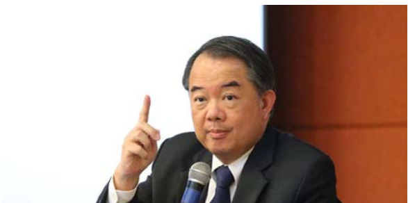
ศ.ดร.นครินทร์ เมฆไตรรัตน์ อดีตตุลาการศาลรัฐธรรมนูญ