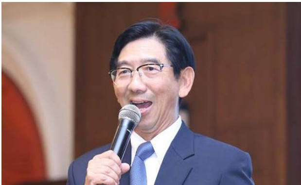
ศ.ดร.สมคิด เลิศไพฑูรย์