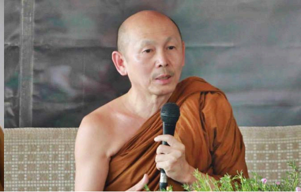
พระไพศาล วิสาโล