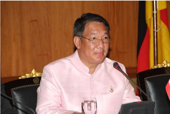
ดร.กิตติรัตน์ ณ ระนอง อดีตรัฐมนตรีกระทรวงอุตสาหกรรม และอดีตรองนายกรัฐมนตรี