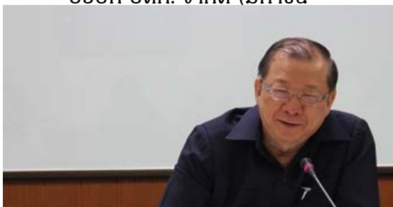
ศ.ดร.พลาพล คุ้มทรัพย์ อดีตคณบดีคณะเศรษฐศาสตร์ มหาวิทยาลัยธรรมศาสตร์