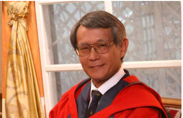
ศ.ดร.ยงยุทธ์ ยุทธวงศ์ อดีตรองนายกรัฐมนตรี