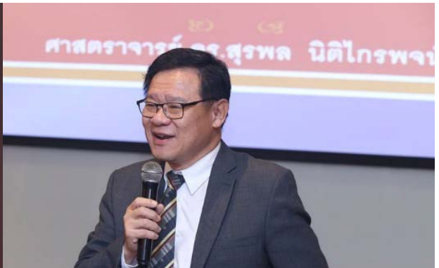
ศ.ดร.สุรพล นิติไกรพจน์