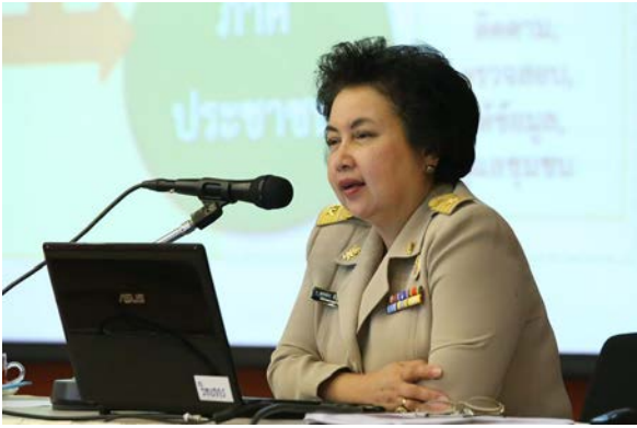
ดร.อรรชกา สีบุญเรือง อดีตรัฐมนตรี กระทรวงอุตสาหกรรมและ กระทรวงวิทยาศาสตร์ และเทคโนโลยี