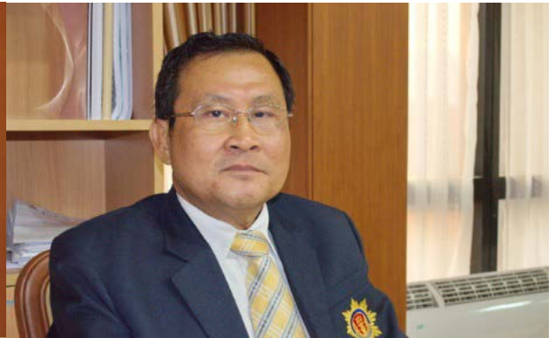
ศ.ดร.ชัยสิทธิ์ ตราชูธรรม ประธานกรรมการตรวจเงินแผ่นดิน