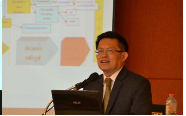
ดร.สมชาย หาญหิรัญ อดีตปลัดกระทรวงอุตสาหกรรม และศิษย์เก่าหลักสูตร นมธ. รุ่นที่ 4