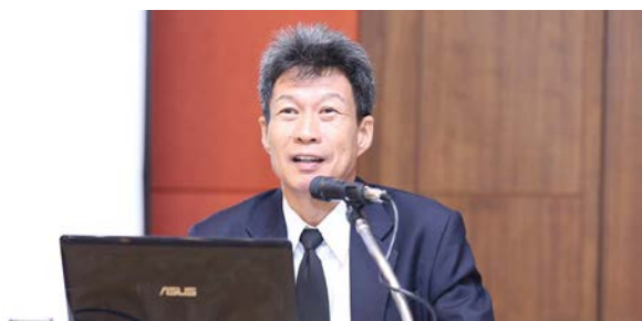
คุณอิสร ปกมนตรี เอกอัครราชทูต ประจำกระทรวงต่างประเทศ