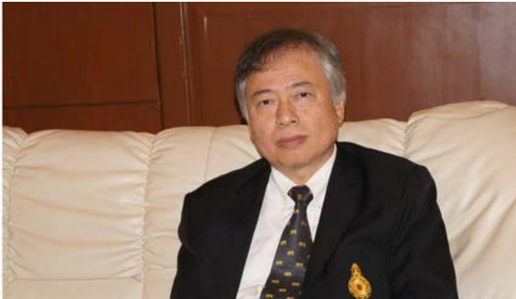
คุณเจษฎา ประกอบทรัพย์ อดีตรองเลขาธิการ สำนักงานคณะกรรมการ ข้าราชการพลเรือน (สำนักงาน ก.พ.)