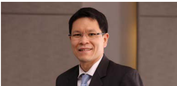
ดร.วิโรไท สันติประภพ ผู้ว่าราชการนครแห่งประเทศไทย