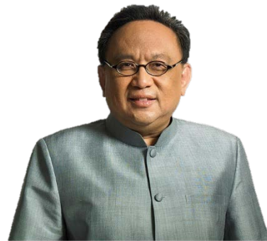
ศ.กิตติคุณ รงทอง จันทรางศุ อดีตปลัดสำนักนายกรัฐมนตรี