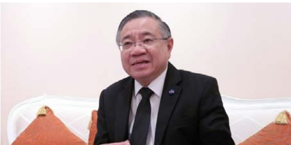
รศ.วุฒิสาร ตันไชย เลขาธิการสถาบันพระปกเกล้า