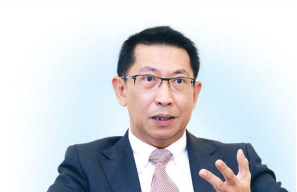
ดร.อารีพงศ์ กุ๋ชอุ่ม อดีตปลัดกระทรวงพลังงาน