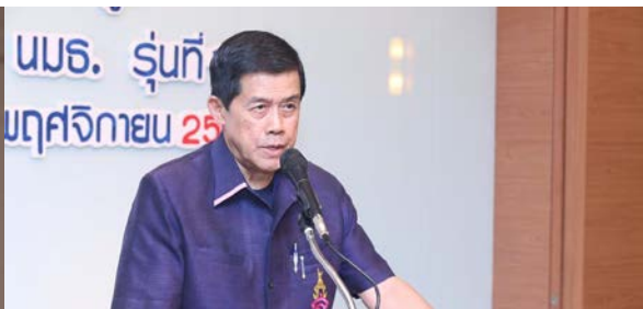
คุณกร ทัพพะรังสี อดีตรองนายกรัฐมนตรี