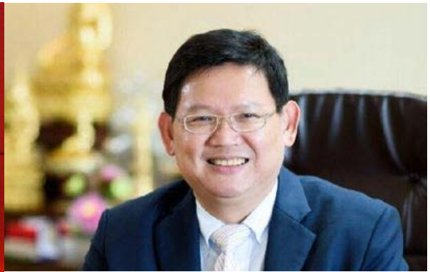
ดร.สุวิทย์ เมษินทรีย์ อดีตรัฐมนตรี กระทรวงวิทยาศาสตร์และเทคโนโลยี