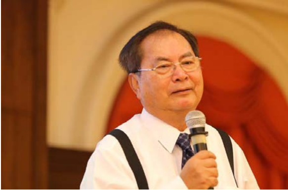
ดร. ทนง พิทยะ อดีตรัฐมนตรีกระทรวงการคลัง และอดีตรัฐมนตรีกระทรวงพาณิชย์