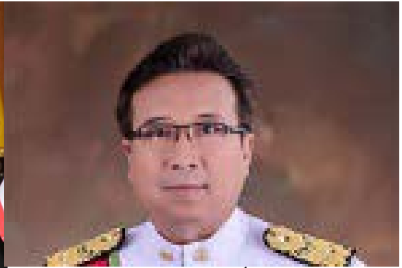
รศ.ม.ร.ว.พงษ์สวัสดิ์ สวัสดิวัตน์ อดีตรัฐมนตรี กระทรวงอุตสาหกรรม